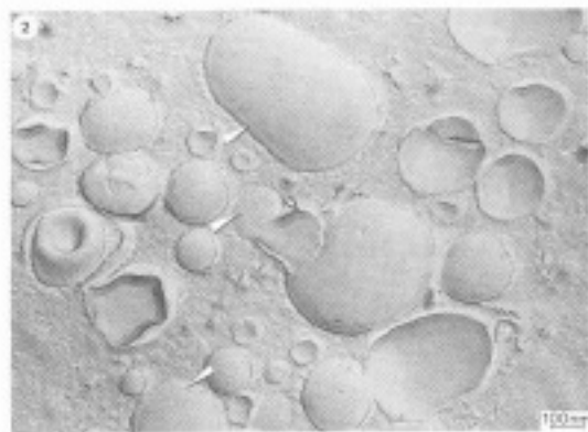
Abb. 2 Wäßrige Liposomendispersion (Vergleich) nach Gefrierbruch-Präparation und 30 s Sublimationszeit